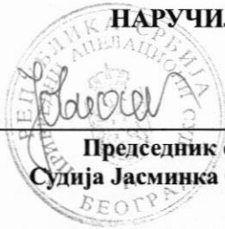
Председник суда Судија Јасминка Обућина